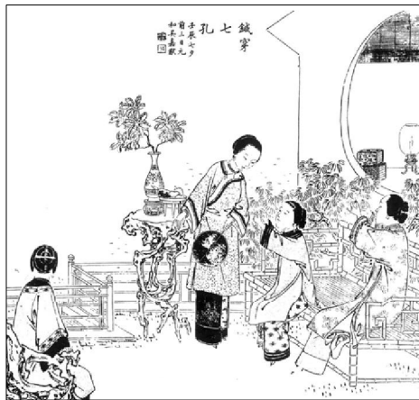
七夕穿针 《吴友如画》

从时间特点方面来看,七夕乞巧习俗主要是在农历七月七日进行,而这个日子对于女性来说有着十分特殊的意义。《孔雀东南飞》诗云:“初七及下九,嬉戏勿相忘。”这里所谓的“初七”与“下九”,是传统社会中两个独特的妇女节日。其中“下九”是指每月的十九日,而“初七”正是指每年的七月初七这一天。每逢这两个时日,妇女们便可以在月下相聚嬉戏,甚至于“忘寐达曙”,游戏到天亮。