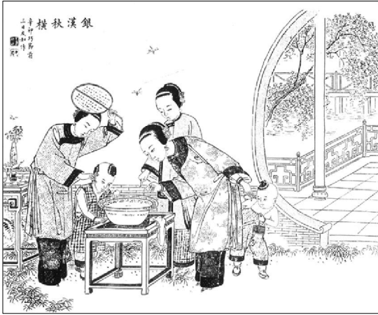
丢巧针 《吴友如画宝》

市，女子七夕“折细草，取浮水中，视其所现之影状如何”，北方农村“用盆水浮豌豆芽，观其所示之象，定女性工拙”。这些习俗方式，实际上都是古代女性们为了验证自己在针线织作方面的才能与天赋而采取的占卜与测试行为，以满足她们对于针线织作技术的心理渴望与心理寄托。